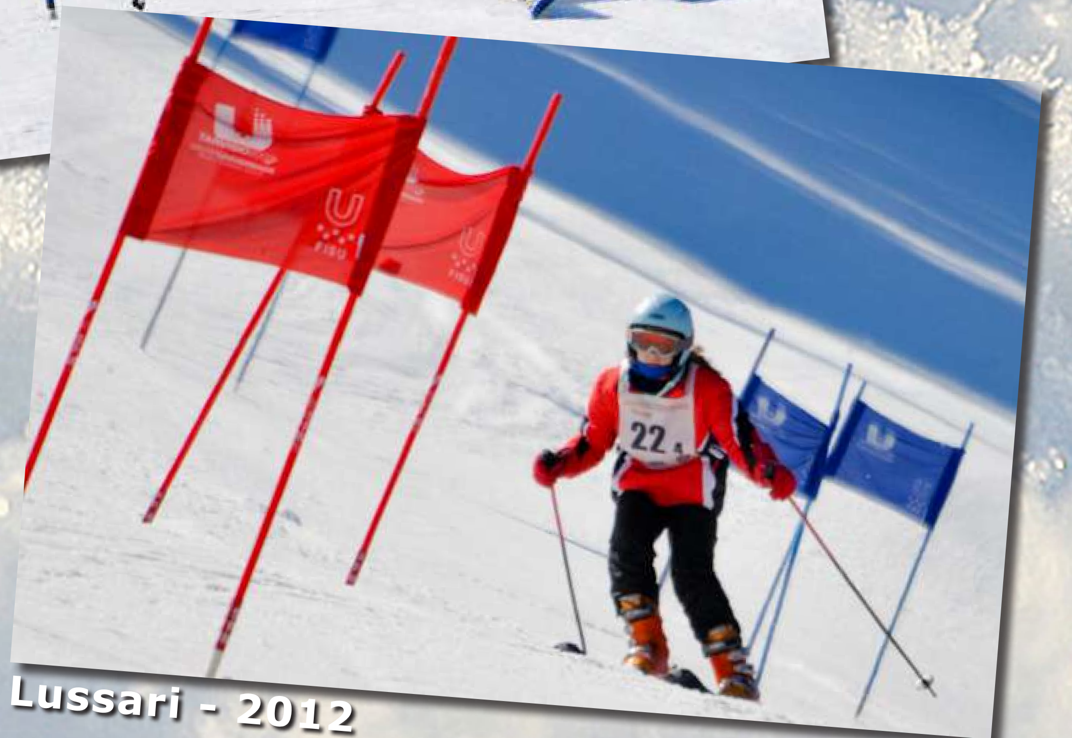
Lussari - 2012